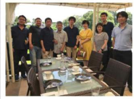
定時総会後の交流会 レストラン湖鏡（こきょう）にて