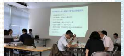
第三回益城町生活支援体制整備事業協議体でのグループワーク風景

住民アンケート結果などから、生活圈移動に関する課題提起とともに、イーモビネットをはじめとした官民による種々の取り組みが紹介されました。