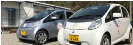
アクセルとブレーキの踏み間違い防止装置「ワンペダル」を実装した小型電気自動車

私たちは、このようなボランティアドライバーを支える安全・安心な仕組みや「支え合い」活動で得てきた知見をもとに、高齢者が自らハンドルを握れる機会を支援すべく、「シニア向けカーシェアリング」など新しいモビリティサービスを展開していきます。