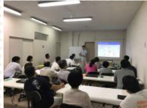
セミナー風景 ピースステーション（天草市）

去る7月28日（土）熊本県天草市にて、当団体の関係者や地域内の事業者などを対象とした観光セミナーを、天草IoTイニシアティブとの共催で開催しました。